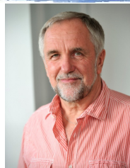
Erling Zetterman Konsult, informatör